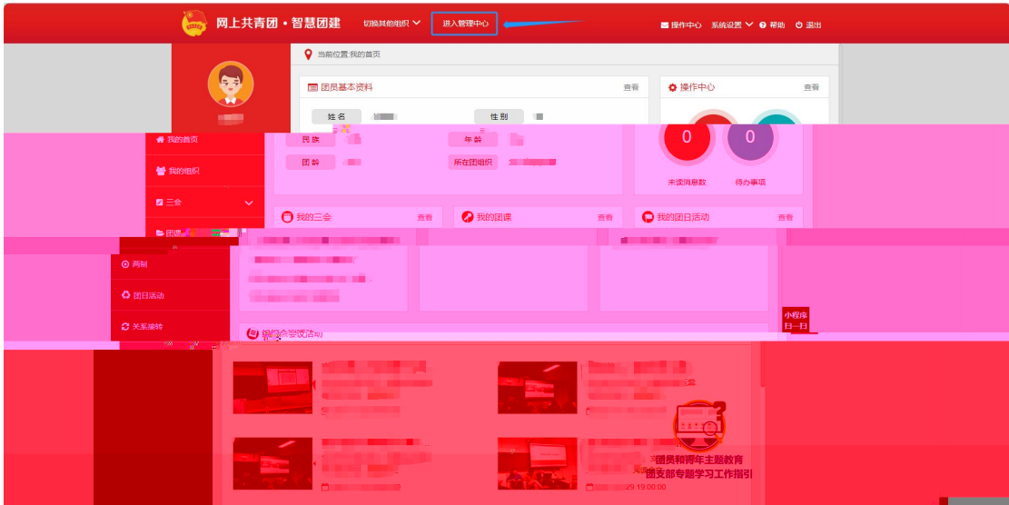
图 2：“ 慧团建 ” 意图

1. 团 员 录 “ 慧团建 ” ， 入 “ 中心 ” （ https://zhtj.youth.cn/zhtj/ ）。